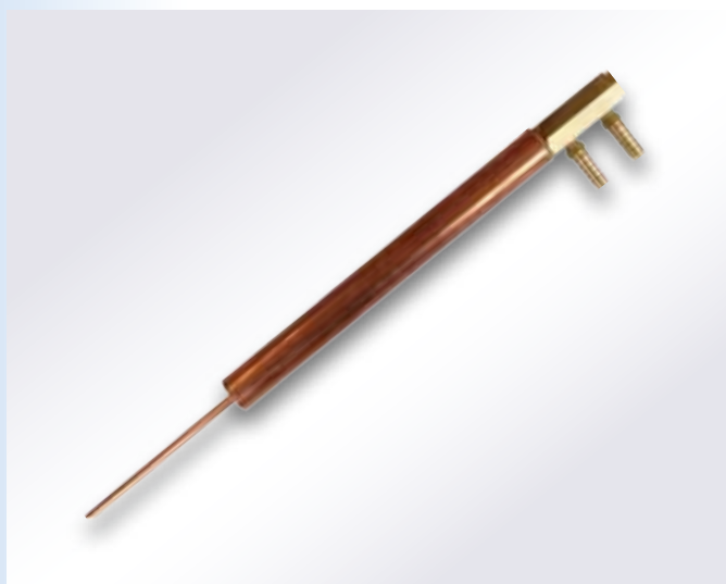
写真はストレートホルダー、分水器、銅パイプのセットです。